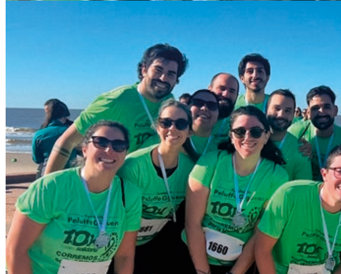
Verde participó como Main Sponsor en 3era Edición de la 10K Solidaria de la Fundación Peluffo Giguens.