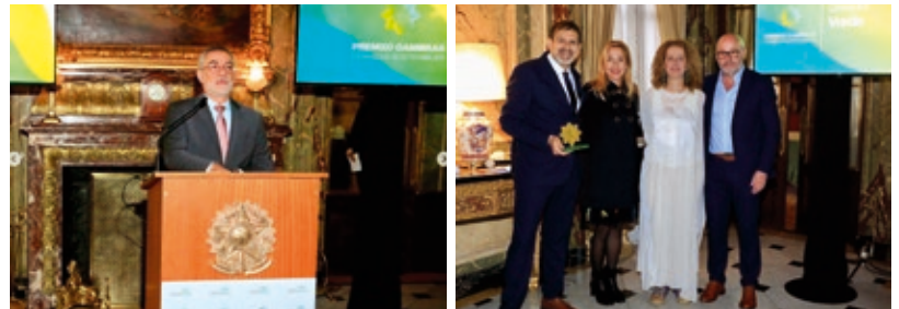
La entrega del Premio Cambras fue realizada en la Embajada de Brasil en Buenos Aires en noviembre de 2023.

La Cámara de Comercio, Industria y Servicios Argentino Brasileña otorgó a VERDE su Premio CAMBRAS de Finanzas Sostenibles en su tercera edición. Este Premio reconoce iniciativas innovadoras que, desde las finanzas, implican la movilización de recursos para la inversión y/o el financiamiento de proyectos a favor del desarrollo sostenible y el impacto positivo en las comunidades.